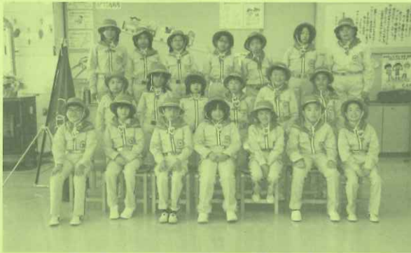
[ 令和5年度緑の少年団員 ]

おottoっ子達は、自分たちの活動に誇りを持ち、夢に向かって挑戦を続けていきます。