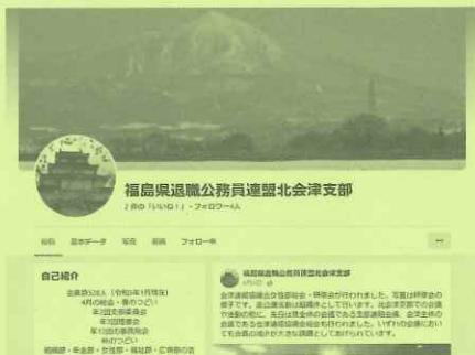
[ ホームページの表紙 ]

新型コロナウイルス感染症が5類に移行されました。この3年間制約を受けてきた支部活動ですが、漸く平常時の活動に戻りつつあります。さらに、コロナ禍での活動をもとにして、新たな取り組みも始まっています。