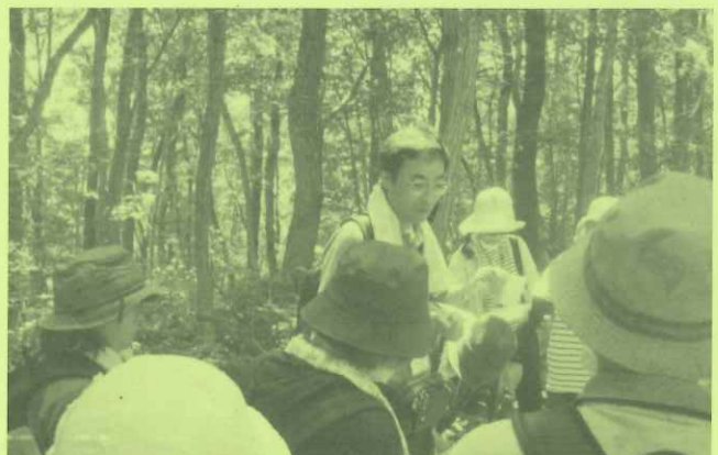
主催事業「なるほど自然塾」

神指分館は小さな館ですが、毎日地域の方を中心に複数の団体がサークル活動で利用します。今日は〇〇さん達だな、と顔を思い浮かべながら、毎朝、館の掃除をすることから1日がスタートします。当館では、生涯学習の場の提供として、6つの主催事業を実施しています。内容は自然・歴史・健康・音楽・ものづくり等たいへん幅広く、それぞれ複数回の講座があり、順次その運営を行っています。また、神指地区地域学校協働事業の事務局として、コーディネーターやボランティアの皆さんにご協力いただきながら、神指小学校での協働活動や放課後子ども教室の推進に携わっています。笑顔で遊び心をもちながら自分も楽しむことを心掛けていますが、地域の方や講座の参加者、神指小の子ども達と大笑いすることが、何よりの楽しみでありエネルギーの源です。