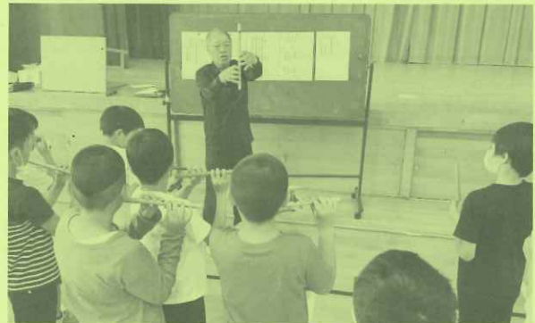
[ 大戸地区お囃子の伝承活動 ]